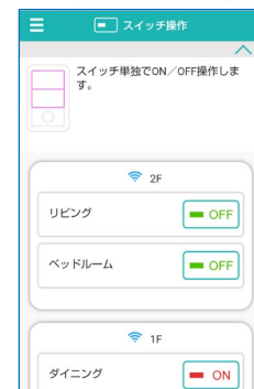
スイッチ操作 画面イメージ