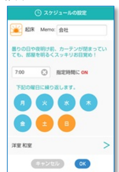
スケジュールの設定画面イメージ