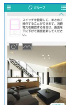
グループの設定画面イメージ