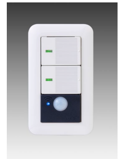
IoT スマートスイッチ 『Link-S 2 』

設定した時間・曜日に指定した照明をON/OFFできます。また防犯対策として、あらかじめ設定した時間帯に照明を点灯させたり消灯させたりすることもできます。